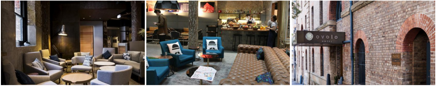
Ovolo 1888 Darling Harbour - piccolo, grazioso ed originale, nel nuovo quartiere di Sydney "Pyrmont", vicino a The Star e a Darling Harbour. Con legni grezzi e mattoni a vista, è l'ideale per chi cerca un hotel particolare e di carattere.